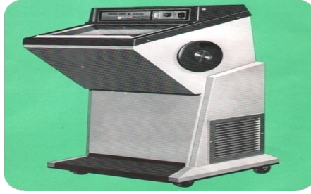
جهاز عمل قطاعات من العينات تحت التجميد