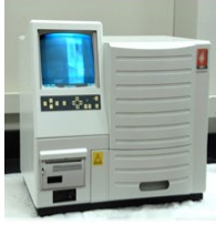
جهاز تفاعل البلمرة المتسلسل