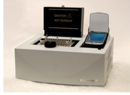
جهاز تصوير الجل