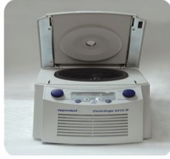
جهاز الطرد المركزي