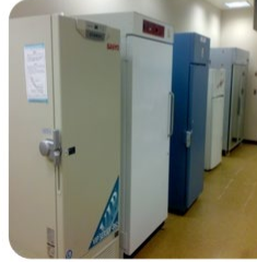
وحدة الحفظ والتحضين