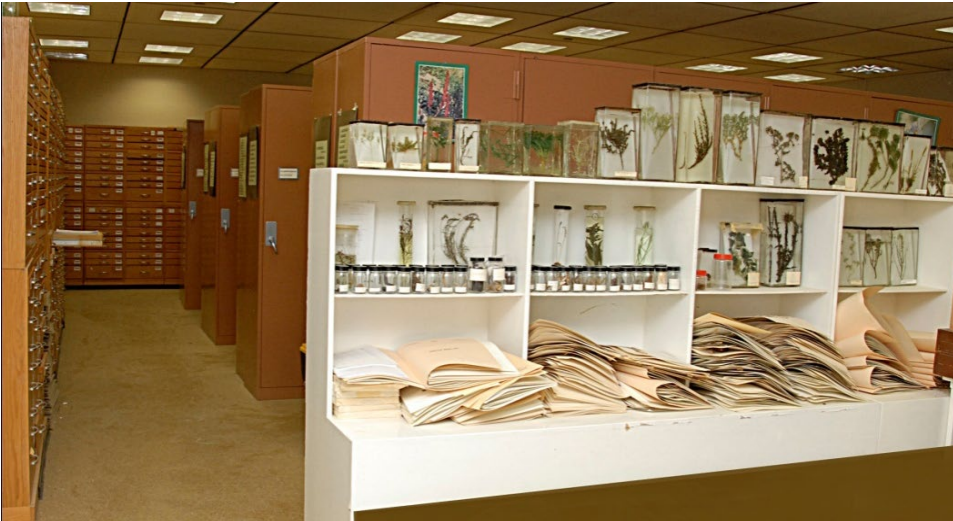
جانب من المعشبة النباتية